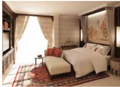
فندق حياة ريجنسي