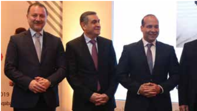
لجنة تقييم البحوث

وسوف يتم الاعلان عن بدء استقطاب الابحاث التأمينية الخاصة بالجائزة المقبلة لمؤتمر العقبة عام ٢٠٢١م في عام ٢٠٢٠ عن طريق اللجنة التنظيمية للمؤتمر الدولي الثامن للتأمين لعام ٢٠٢١م، حيث سيتم نشر الشروط والتعليمات الواجب توافرها في البحث لاغراض قبولها وموضوع البحث الذي سيتم تحديده في حينه الاعلان عنه من خلال الموقع الإلكتروني الخاص بالمؤتمر الدولي الثامن للتأمين لعام ٢٠٢١م.