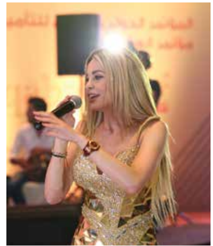
المغنية اللبنانية دومنيك حوراني و الفرقة الاردنية حرقة كرت