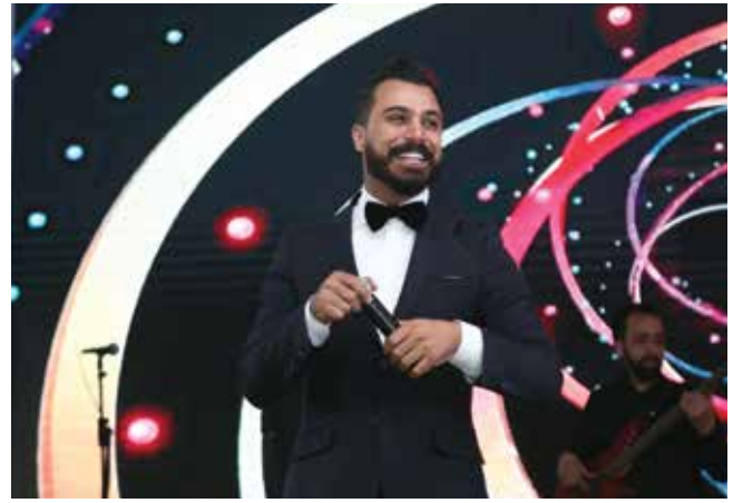
الفنانة ستفاني نعواس