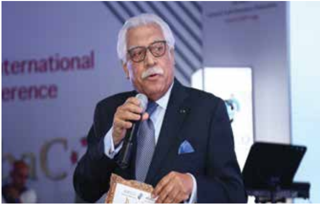
معالي السيد عقل بلتاجي

استضافت الشركة الأردنية الفرنسية للتأمين (جوفيكو) احدى الشركات الراعية للمؤتمر (راعي رئيسي) حفل عشاء ساهر في اليوم الثالث للمؤتمر يوم الاربعاء الموافق ٢٠١٩/٤/١٧ على شرف المشاركين في المؤتمر الذي أقيم في فندق انتركونتيننتال العقبة، حيث رحب معالي السيد عقل بلتاجي بالحضور من ضيوف الشرف والمشاركين، حيث أحيى الحفل الفنان الاردني حسين السلطان وفرقة نعواس.