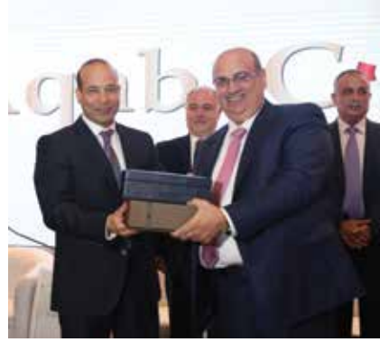
سعادة الدكتور علي الوزني