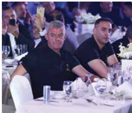
الفنان الأردني حسين السلطان