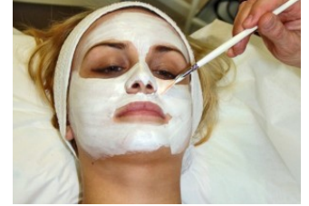
تركيبة تقضي على التجاعيد تماماً، تمتعي بمظهر الـ 21 سنة في سن الـ 51