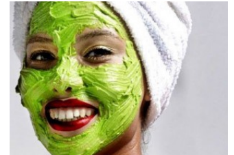
تخلصي من التجاعيد في 14 يوماً، تمتعي بمظهر شبابي وإظهري بعمر الـ 20 وأنت في سن الـ 50