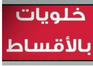
خلويات أقساط لكل الناس على الهوية الشخصية فقط