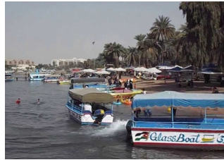
ممارسات غير لائقة على شاطئ القندور و المجالي يطالب بتعريف السياح على عادات ابناء العقبة