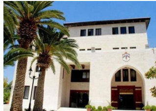
قرارات هامة لمجلس الوزراء .. (تفاصيل)