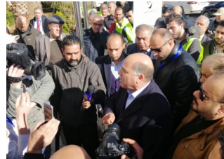
بالفيديو والصور.. الشرطة تحاصر جمعية الاسكان.. لجنة الانتخاب تنسحب .. والمستثمرون في قاعة الاسكان يعتبرونه يوماً اسود