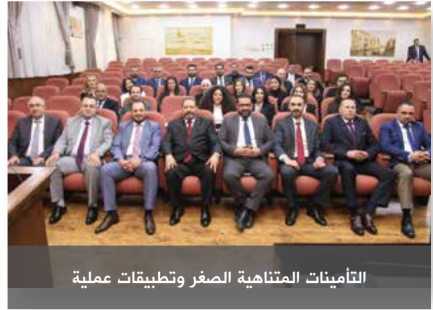
التأمينات المتناهية الصغر وتطبيقات عملية