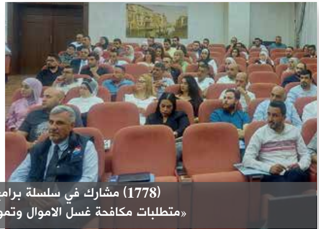
(1778) مشارك في سلسلة برامج تدريبية مجانية لشركات التأمين «متطلبات مكافحة غسل الأموال وتمويل الارهاب من منظور الجهات الرقابية»