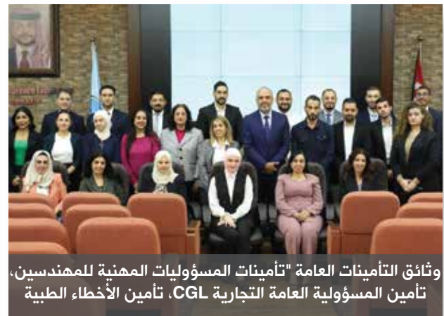
وثائق التأمين العامة "تأمينات المسؤوليات المهنية للمهندسين، تأمين المسؤولية العامة التجارية CGL، تأمين الأخطاء الطبية