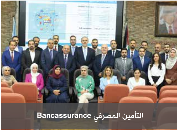
التأمين المصرفي Bancassurance