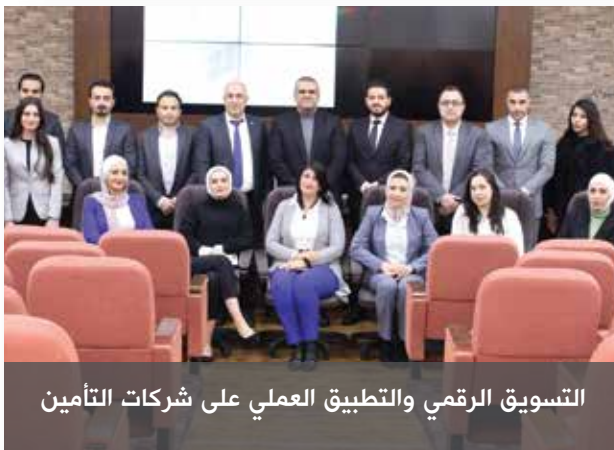
التسويق الرقمي والتطبيق العملي على شركات التأمين