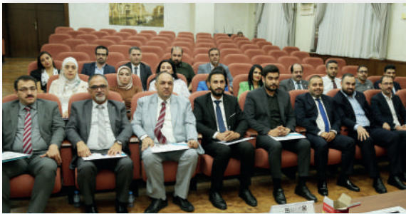
البرنامج التدريبي على مستوى عربي التعامل مع إجراءات التحكيم في حل النزاعات في التأمين-أيلول/٢٠٢٤