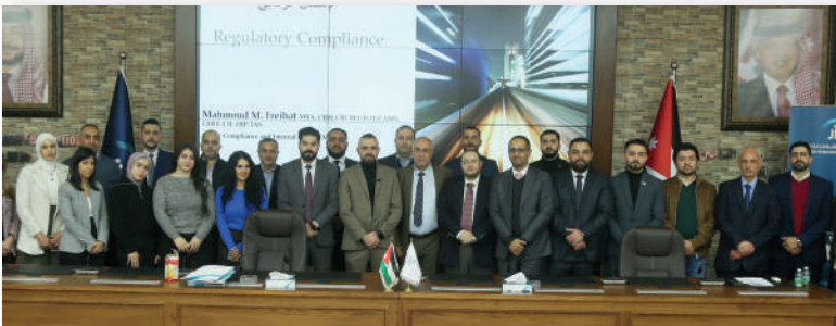
البرنامج التدريبي على مستوى عربي الإمتثال الرقابي- كانون الأول/٢٠٢٤