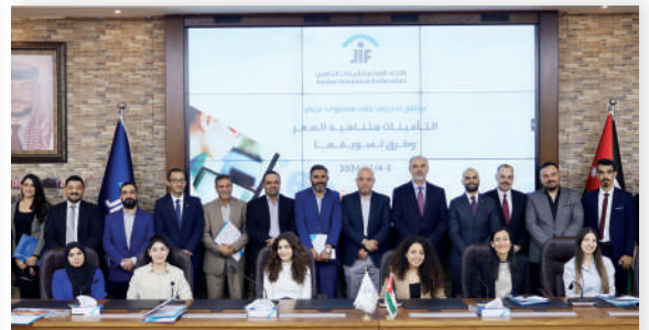
البرنامج التدريبي على مستوى عربي التأمينات متناهية الصغر وطرق تسويقها - تشرين الثاني/٢٠٢٤