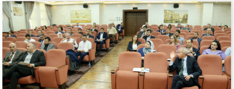
البرنامج التدريبي على مستوى عربي تطبيقات عملية على المعيار المحاسبي IFRS17-حزيران/٢٠٢٤