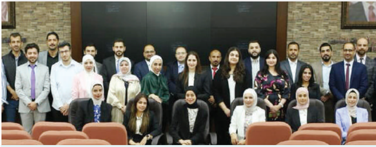
البرنامج التدريبي على مستوى عربي المكونات الرئيسية لدائرة إدارة المخاطر-أيار/٢٠٢٤