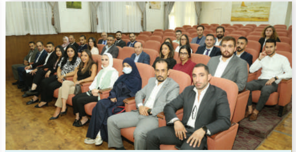
البرنامج التدريبي على مستوى عربي تأمينات المسؤولية المدنية الخاصة-آب/٢٠٢٤